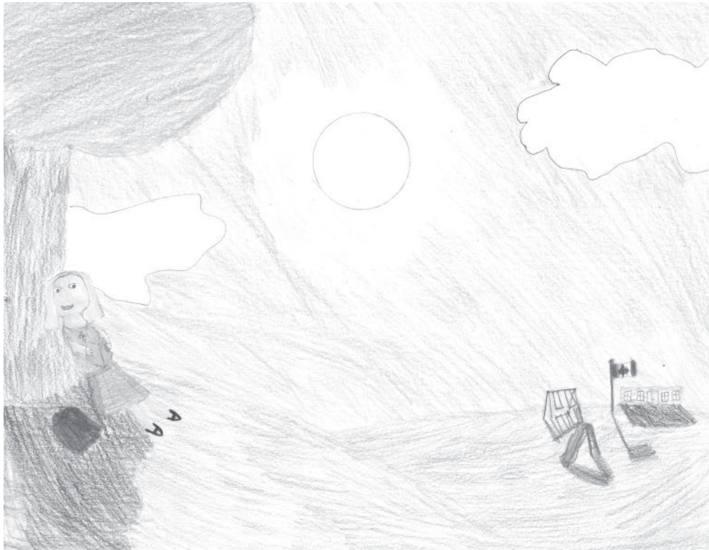
Suzanne, Grade 6 / 6 e année - Wayside Academy