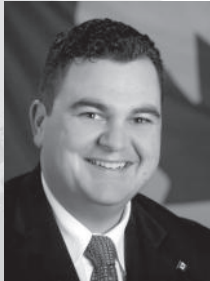
Dean Del Mastro