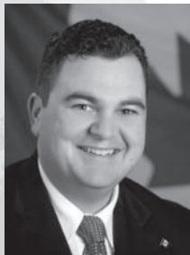
Dean Del Mastro