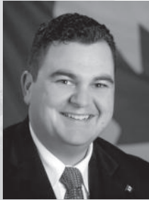
Dean Del Mastro