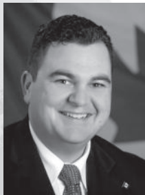
Dean Del Mastro